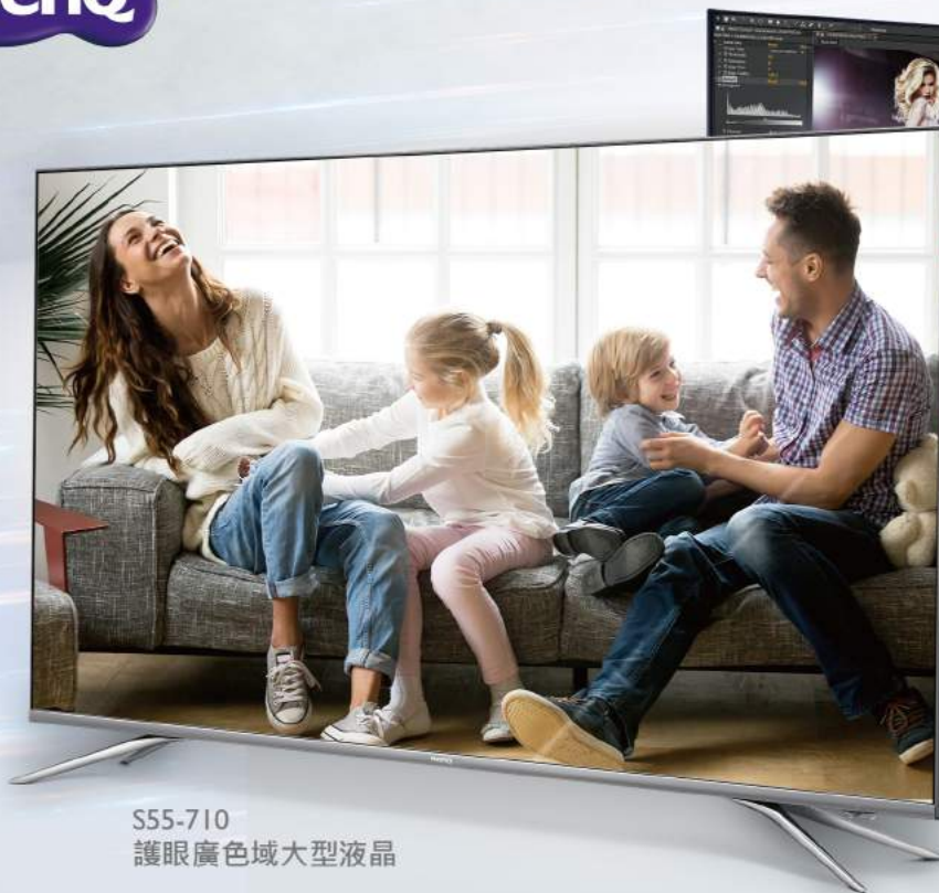
S55-710 護眼廣色域大型液晶