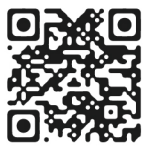
BenQ活動贈品兌換網站