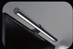
*以上圖示為參考，贈品以實品為準